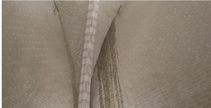
"Cascada" en el refectorio medieval

El día 6 de julio cayó sobre Zaragoza una lluvia torrencial con granizo que afectó a toda la ciudad. Aunque afortunadamente no tuvimos que lamentar heridos, pudimos ver impactantes imágenes de vehículos siendo arrastrados por la corriente, calles inundadas y muchos desperfectos en la ciudad. El Monasterio no se libró de sufrir las consecuencias de la tormenta y junto a las habituales goteras tuvimos diferentes muestras de humedad en todo el edificio como el de la imagen, una "cascada" de agua en pleno refectorio mudéjar del siglo XIV.