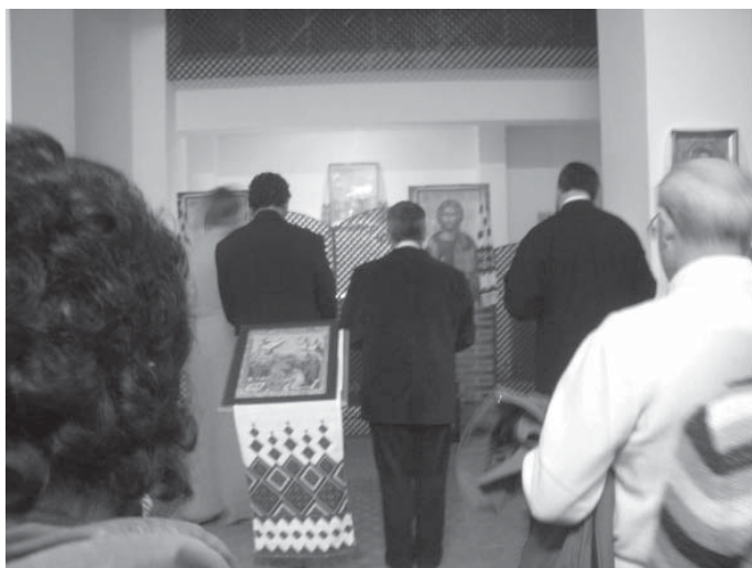
El argumento sensible y profético de que tú, oh Jesús, Estás vivo entre nosotros.